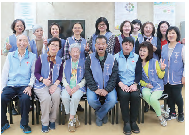
▲達米盎祈禱室志工們與病患之友會，喜樂慶周歲。

這1年來，志工們在活動設計中絞盡腦汁，想辦法與他們玩唱在一起，除了帶動唱、手語、