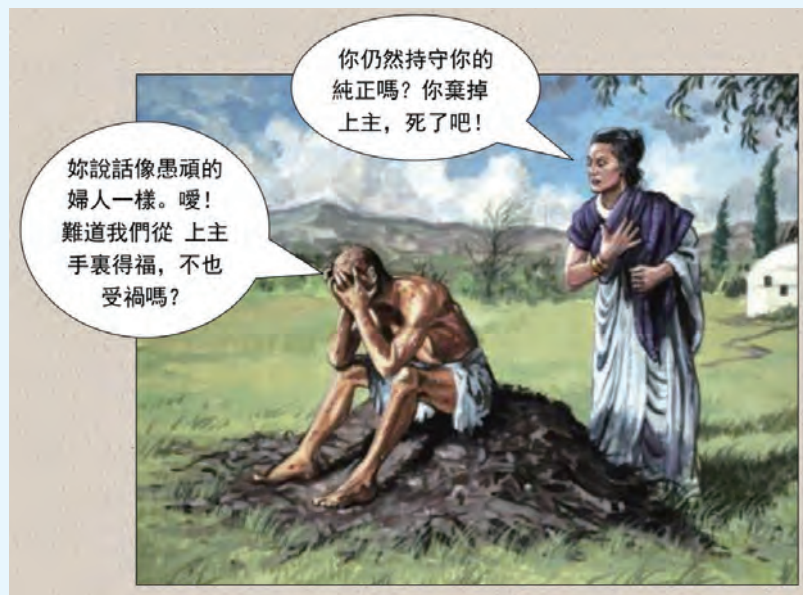
▲約伯和他妻子的對話，讓我們感受到約伯身心靈上所受的煎熬。

上主的榮耀。今日，上主也在祂兒女中運行，藉軟弱的人勝過強壯魔鬼：「賜平安的上主快要將撒殫踐踏在你們腳下。」（羅16:20）