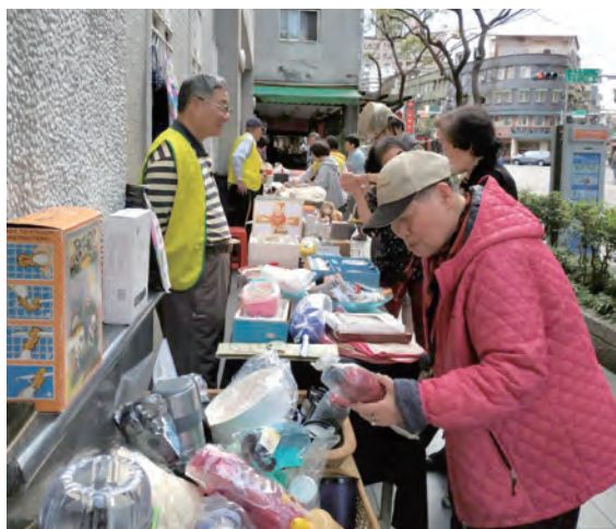
▲連續3年的義賣吸引許多非教友響應，為了幫助部落，不少人從顧客變成捐贈者。

「天主把我們放在哪裡，就在哪裡開花。」高神父期勉教友，這是一種使命感，讓大家團結協助那「比我們小的」，「就算我以後不在永和堂了，這個活動只要開始，就不會結束。」