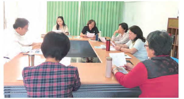
▲避靜使志工們更謙遜交託，全心依靠。

本課程的目的在於隨著自我認識的加深而能更貼近來電者的心，幫助自己也幫助他人面對人生起伏、陰晴圓缺。勉勵自己要常做這些自我激勵的練習，日積月累，一定能走出內心幽谷，迎向生命陽光。