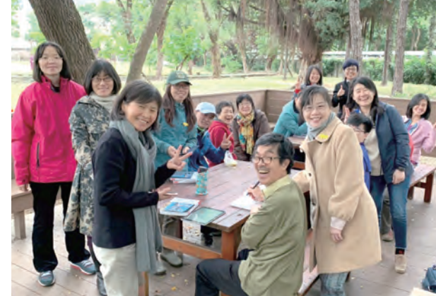
▲無私分享與彼此鼓舞的Camino交流討論 ▲Camino朝聖研討會全體夥伴合影

春日和暖的3月下旬，一群朝聖者從輔仁聖博敏神學院輕輕搖醒一堂朝聖課。近年來，因聖雅格朝聖路的風潮盛名，2019-Camino朝聖研討會意外吸引了近百位聆聽者，共同沉浸一場千年古道的探訪擁抱。策畫研討前後，我有幸目迎目送剛剛落幕的朝聖研討會，也很驚奇望見去年才剛從聖雅格之路朝聖回來的劉丹桂主教，還有認識與不認識的朝聖夥伴，在這熟悉與不熟悉的臉龐裡，我們已難得聞見中世紀第三大朝聖地所帶來的許諾。他們之中有以25天、30天、33天，甚至60天完成不同的Camino旅程，在這不同路線的旅程，特別是一種朝聖溫熱，適當傳遞出聖雅格之路那獨特「痛苦與愛」的訊息，或說，經由朝聖者的一步一腳印，簡直把未來朝聖者的心給照亮了。