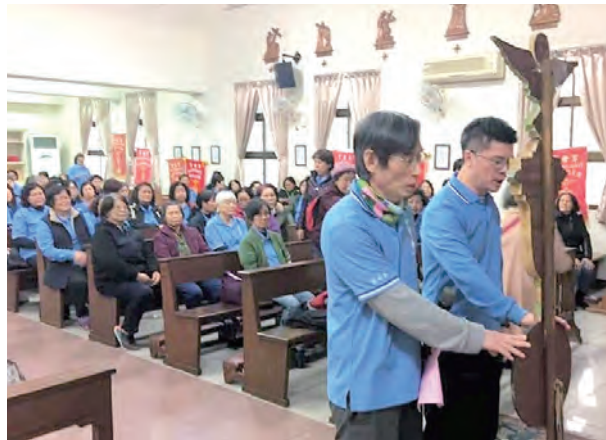
▲新竹教區聖母軍宗徒之后區團檢閱，手握軍旗，向聖母宣誓。

第7句： 父啊！我把我的靈魂交託在祢手中。（路23:46）耶穌最期待的回歸：從天主而來