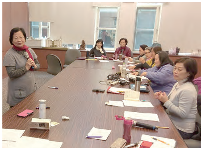
▲定期舉辦的志工月培訓，是裝備自己的最佳養分。