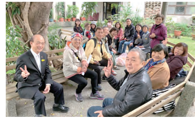
▲榕樹下的小組分享