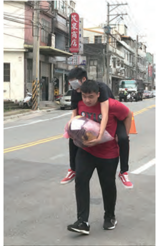
▲看不見、不能走，體驗軟弱、全然交付。