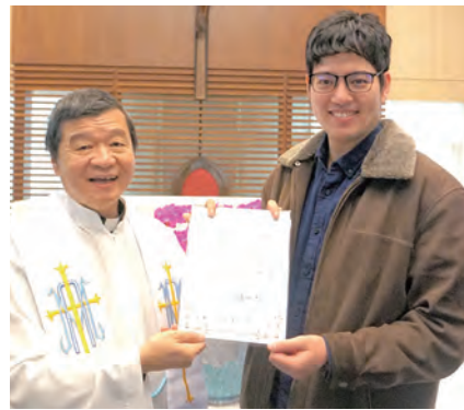
▲▲第4期的兩位新志工接受孫副主教的派遣，裝備好自己準備作主的器皿，為家庭服務。 ▲家協志工樂於服務家庭問題