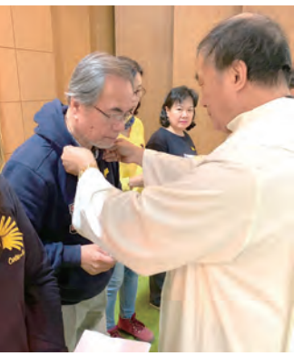
▲Camino陪伴天使戴上十字架