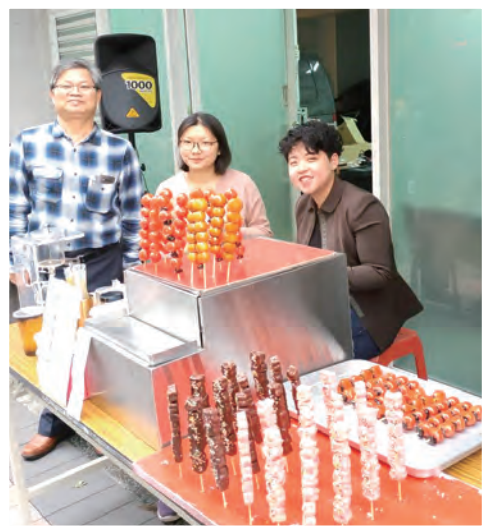
▲臉書「我是永和人」社團的朋友特地自製糖葫蘆參加義賣，所得全部捐出，令人感佩。 ◀3年來，不管是教友南下或是互助的小朋友北上，共融的場合總是溫馨感人。