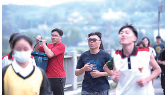
▲在千人越野賽中體驗逃難時的緊張與擔心