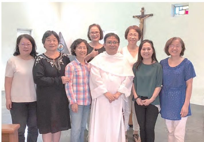
▲台北總教區家庭協談中心2018年的年度避靜，志工們收穫滿盈。