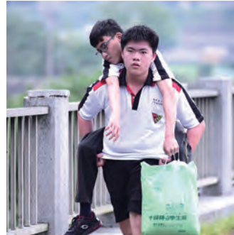
▲邊走邊思考著真正的難民何時才能抵達終點、得到庇護。