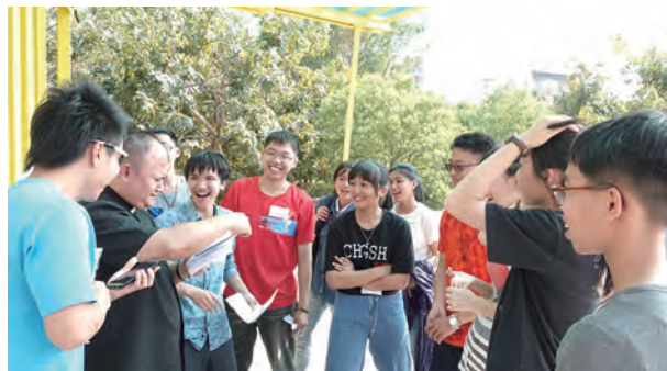
▲神父們也和青年一起參加闖關遊戲

蘇主教綜合大家的回應說道：「信仰告訴我們天主無條件愛我們，我們是天主獨一無二的愛子愛女，這就是我們真正的身分，我們真正的歸屬。我們的使命就是在基督的奧體教會內活出這身分以答覆天主這愛的召喚。努力活