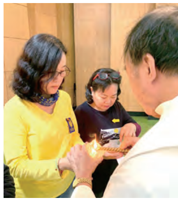
▲傳遞Camino之光的陪伴天使