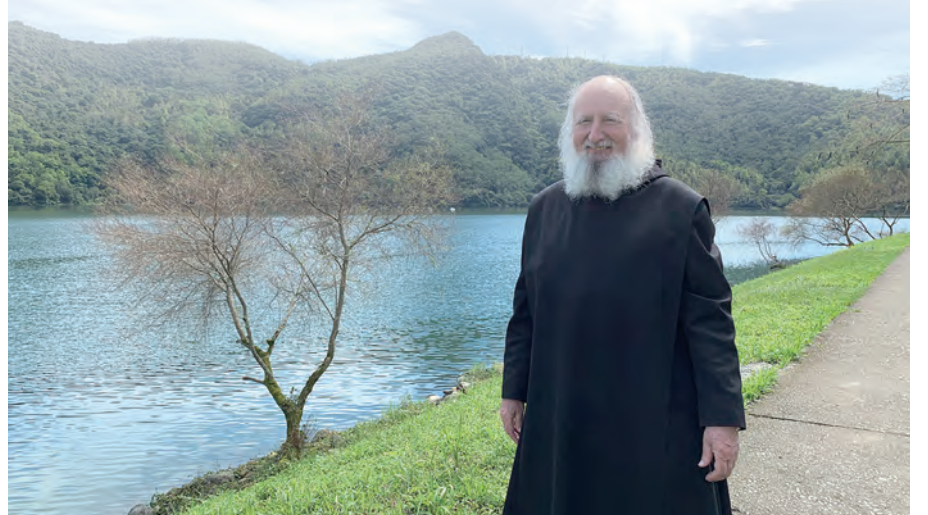
▲古倫神父5度造訪台灣作牧靈講座，在花蓮教區帶領青年靈修營時怡然留影。

◀古倫神父與耶穌會谷寒松神父、聖母聖心會吳偉立神父、沙勿略會鮑霖神父及聖母聖心愛子會杜仁神父等，一起參與基督徒合一祈禱。