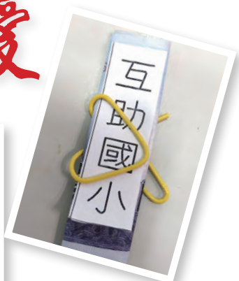
▲◀一只愛心迴紋針，夾著1000元裝在奉獻袋裡，主的恩典，總是讓我們永遠夠用。

契是如此珍貴，無形中建立了堂區和社區鄰里的好友誼，而透過義賣活動的效應，還意外促成了「五里」專案：那就是在今年聖誕節，將有五個里與永和堂共同舉辦園遊會，為宗座善會的小朋友募款。「如果沒有當初的義賣，就不會有這麼多愛的連結。」高神父說。