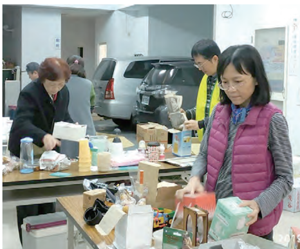
▲熱心教友捐贈的物資堆滿教堂，志工辛苦分類整理。