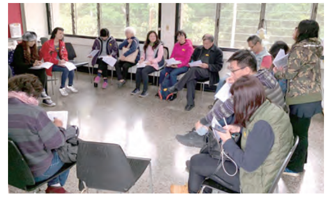
▲小組討論各抒己見，提供許多寶貴經驗和心靈豐收分享。