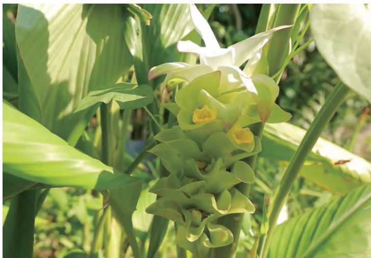
▲聖賀德佳學院與台中教區上智文教基金會合作開課，展開香草DIY工作坊的聖賀德佳大自然療癒力學習。