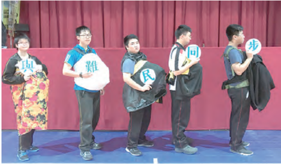
▲甜蜜的負荷，體驗難民中的孕婦。