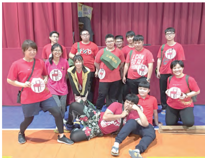
▲漫漫上學路，關注世界失學兒童

關注難民的人權議題是這一學年來內思學子努力學習的方向，無論是戰爭難民、氣候難民、政治難民都有更多的認識、反思與行動，願我們能透過各種努力來協助旅途中的脆弱者，如同教宗所呼籲的：「和平是人人該擁有