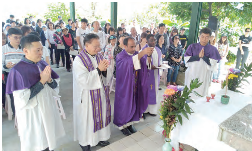
▲八分寮聖山清明追思彌撒後，向祖先及親友恩人行追思禮。

杜神父也利用這個機會向大家道謝與道別，他在4月13日辦理交接，卸下聖母升天堂主任職務，在基隆服務十幾年，感謝大家的支持與幫助。彌撒於11時結束後，神父們至墓園中為教友灑聖水、祈禱。